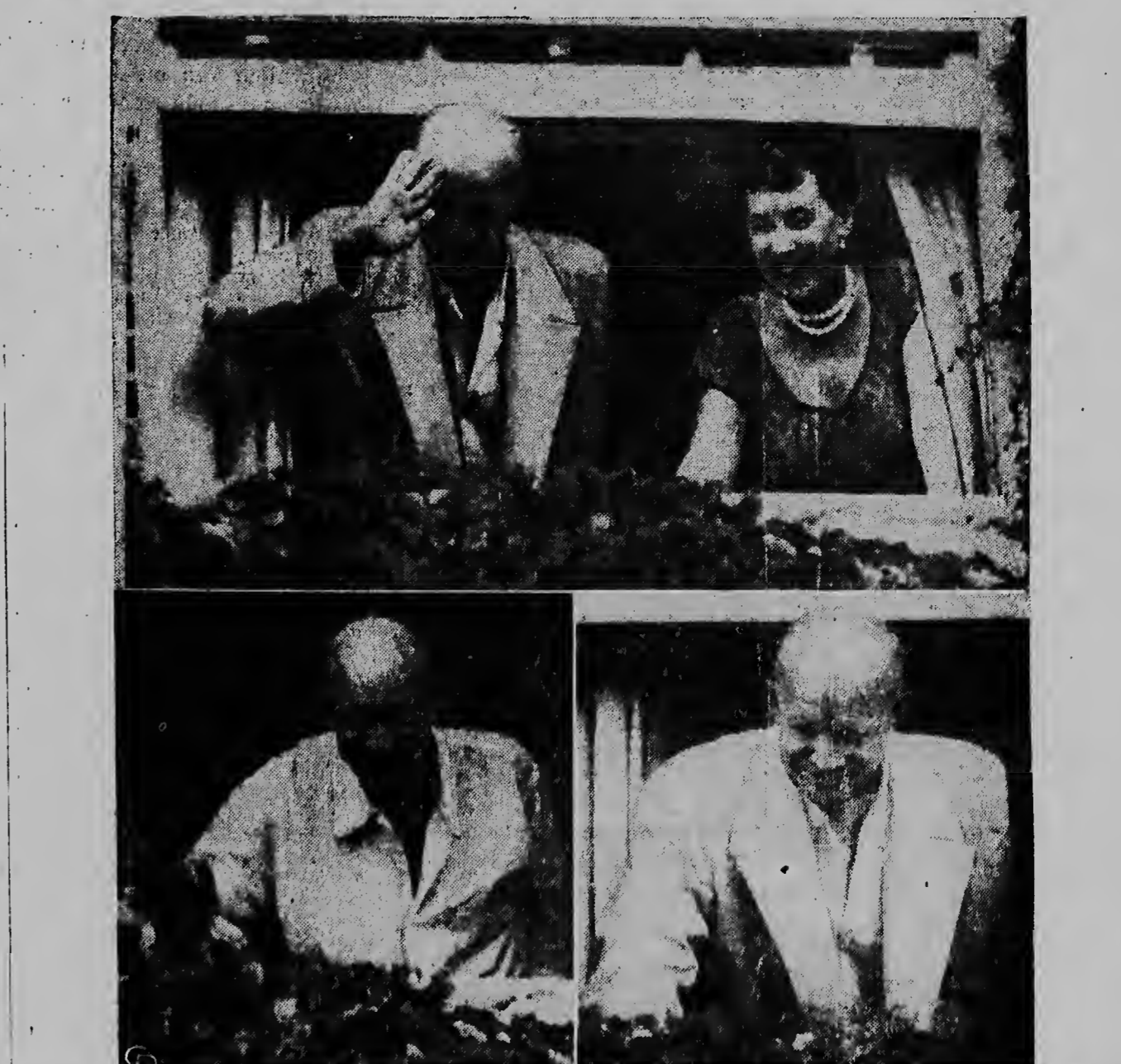
E fotonan aki saca for di un distancla ta e prome nan for di despues di su enfermedad y operacion. Arriba: E ta saluda for di bentana di Walter Reed hospital na Washington. Bando di die ta senjor Eisenhower. Abao: Das bisti na momento cu e a senchando banda di army americano ta tocando pele riba terreno di hospital. Mientras tanto y a President Eisenhower a completa su cura na su rancho durante un paar di siman te ela cuminsa haci su trabao diario na White House atrobe.